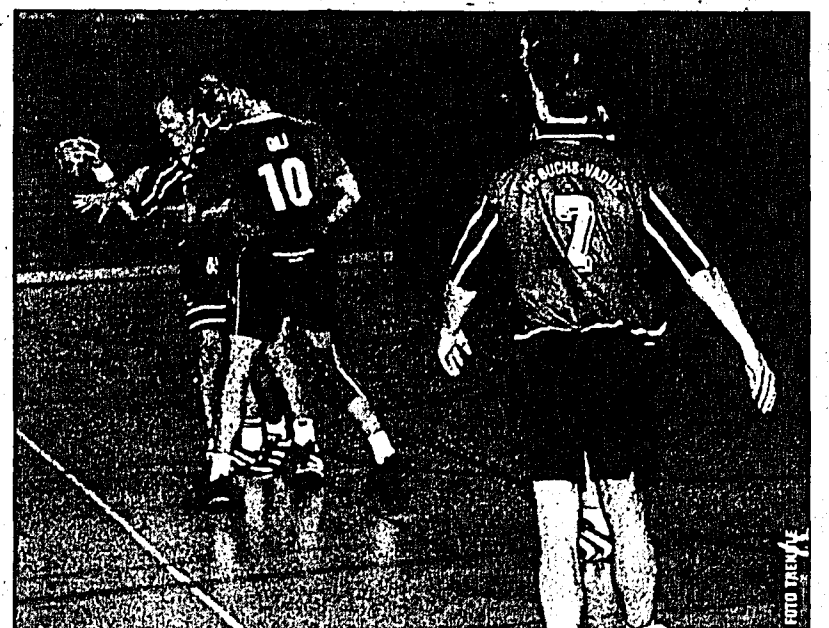
Grosser Einsatz am Kreis und die alten Dresse vom ehemaligen Club HC-Buchs-Vaduz sind ein Zeichen dafür, dass noch nicht alles rund läuft beim HCU.

Dann wurde das Spiel immer hektischer, beide Seiten diskutierten mit dem Schiedsrichter, anstatt sich aufs Handballspielen zu konzentrieren. Kaum war die zweite Hälfte angepfiffen, so hiess es auch schon 13:10 und 16:13.