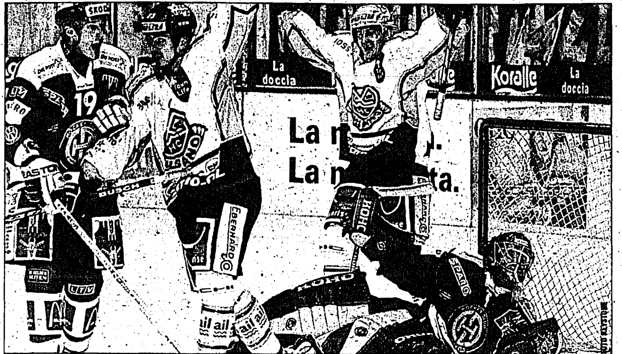
Lugano schoss sich mit dem 9:3 gegen den HC Davos an die Tabellenspitze.

LUGANO - Lugano ist nach nur 24 Stunden und in ganz grossem Stile an die NLA-Tabellenspitze zurückgekehrt. Die Tessiner deklassierten den HC Davos 9:3 und profitierten gleichzeitig von der 2:7-Schlappe des SC Bern bei den ZSC Lions.