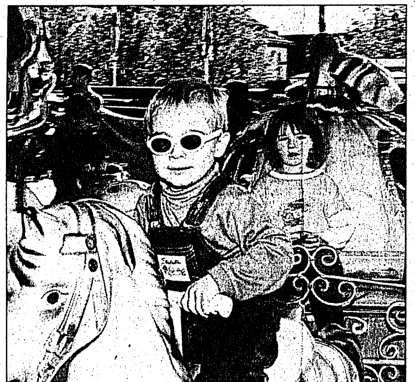
«Hü, Rüssli, hü» – das Karrussell erfreut die Kinder auch heute noch.