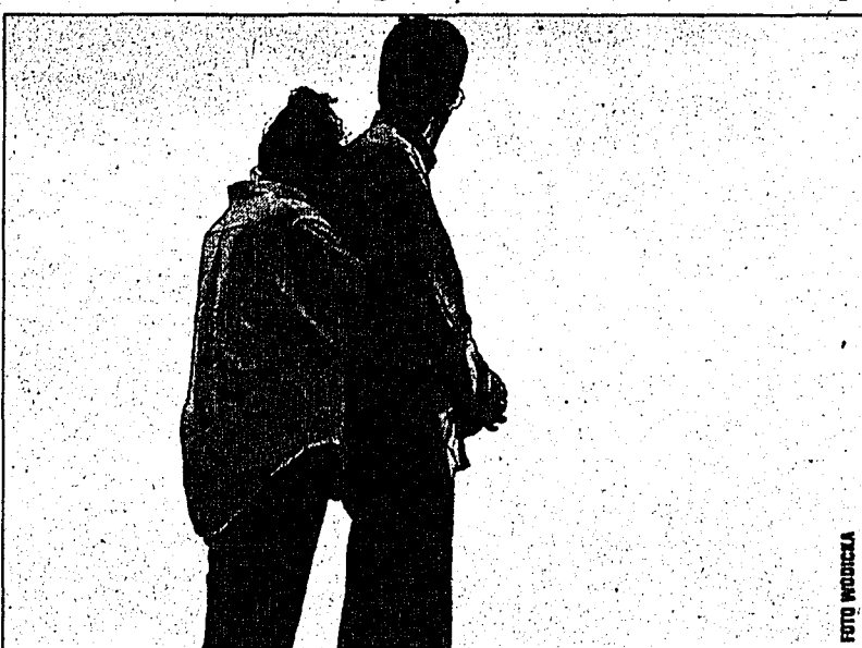
Die wichtigste Hauptsache der Welt: Bei «Liechtenstein sucht die Liebesgeschichte 2003» dreht sich alles um die Liebe.