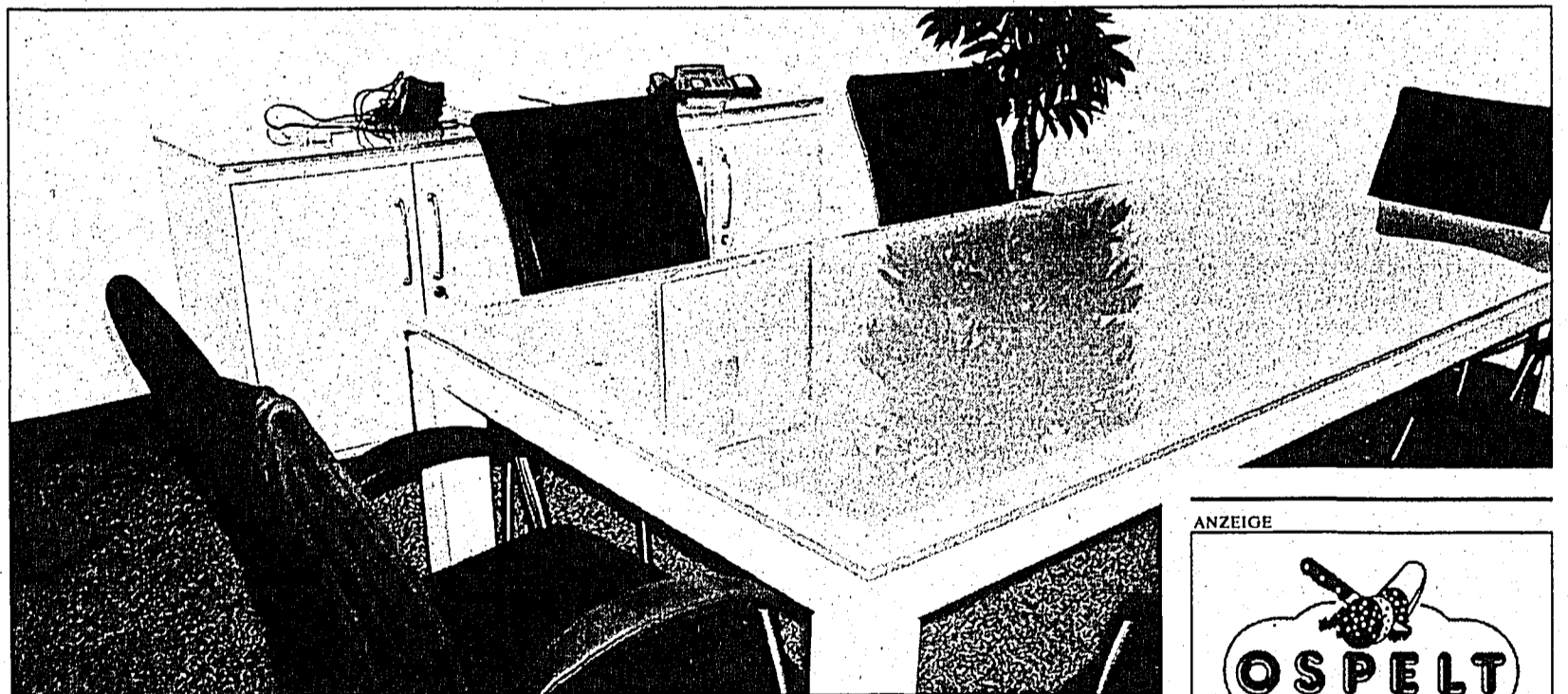
Auf ins VOLKSZIMMER! Wer am Wettbewerb teilnehmen will, kann dies noch bis nächsten Freitag tun.