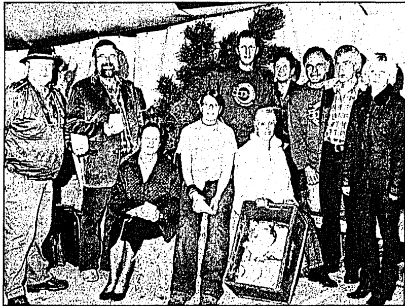
Die glücklichen Gewinner des Alpenquiz, welches die Kulturkommission Schaan landesweit durchgeführt hat.

nen, Speck und Alpkäse sorgten im Schaaner Rathauszelt für das leibliche Wohl der zahlreichen Gäste. Musikalisch wurde der Anlass mit Konzerten der Harmoniemusik Schaan und dem Jodelclub Edelweiss umrahmt. Die Kulturkommission der Gemeinde Schaan führte im Rahmen des Jubiläums landesweit ein Alpenquiz durch. Zu gewinnen gab es unter anderem als Hauptpreis eine halbe «Alpsau». Die Verlosung und Preisverleihung fand beim Äplerfest statt.