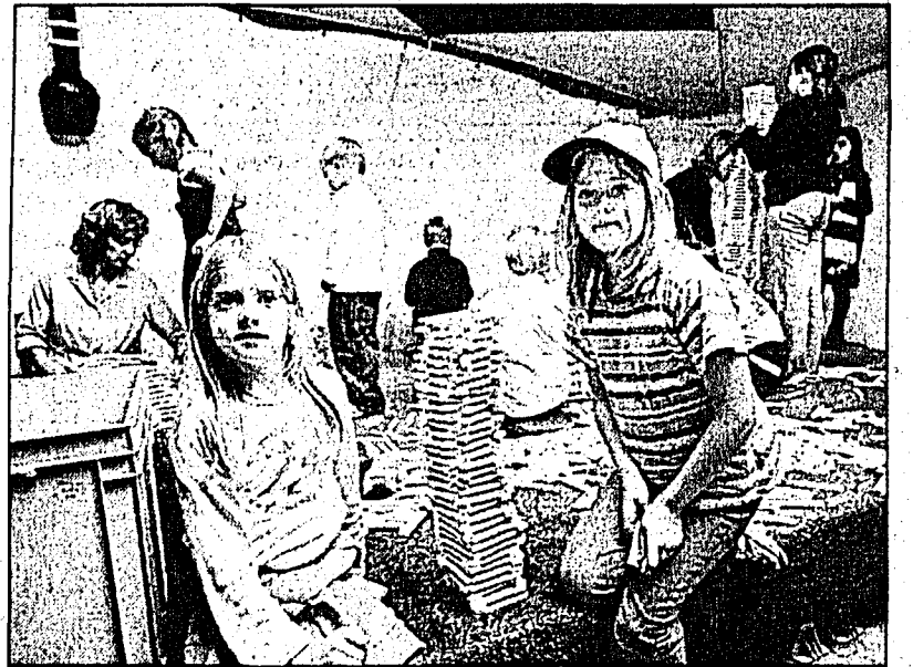
Eine spannende Spielecke sorgte dafür, dass es den Kindern nicht langweilig wurde.