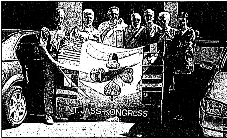
Unser Bild zeigt das Kongresspräsidium mit Begleitung bei einer Rast auf dem Weg nach Meran.

MERAN – Ganz im Zeichen des Kartenspiels stand kürzlich die sonst eher beschauliche Kurstadt Meran in Südtirol. Kein Wunder, zelebrierte dort der in Fachkreisen so renommierte Internationale Jasskongress sein 25-jähriges Bestandsjubiläum.