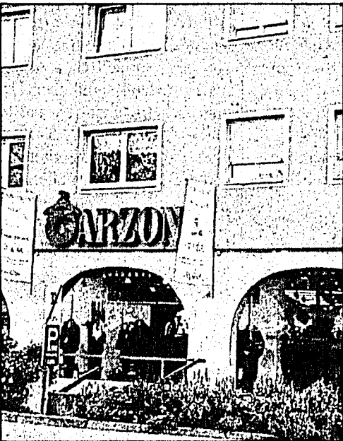
Garzon, das Fachgeschäft, um Mode zu erleben!

Über Ihre Anmeldung unter 0043 / 5572 / 20 8 04 oder E-Mail: info@garzon.com freut sich das Garzon Modeteam.