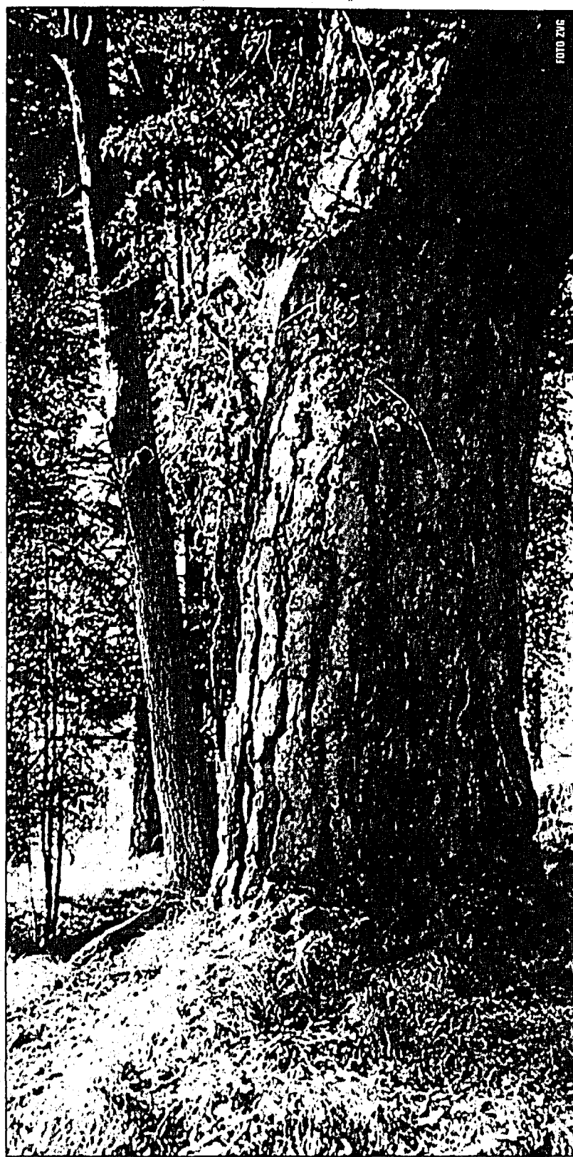
Die Hitze und die Trockenheit dieses Sommers machen den Wäldern arg zu schaffen.

Waldbrände haben während der diesjährigen Hitzewelle in ganz Europa gewütet. In Spanien, Portugal, Italien und Griechenland hat sich die durchschnittlich vollständig abgebrannte Fläche seit den 60er-Jahren vervierfacht. Dieses Jahr war das verhängnisvollste seit Beginn der Messungen. Und jetzt droht eine neue Gefahr: Überall in Europa sind die Böden vertrocknet. In weiten Teilen Europas ist zwischen März und Juli lediglich die Hälfte der üblichen Regenmenge gefallen, ein grosser Teil davon in kurzen, heftigen und lokalen Regengüssen. Eine weitere Schwächung durch Trockenheit und Feuer verkraften die europäischen Wälder nicht mehr. Sie zeigen ernste Stresssymptome. Eines davon ist das Abwerfen der Blätter (und Nadeln). Normalerweise ist gelbes Laub auf dem Boden ein erstes Anzeichen von Herbst –