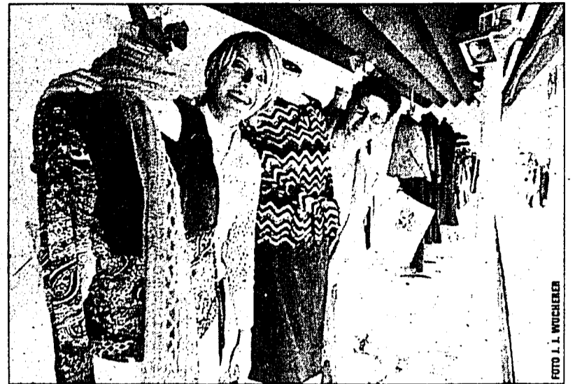
Die neuesten Modetrends waren am Samstag bei Faoro Moda in Schaan zu bewundern.

Einfach anziehend ist das vielfältige Sortiment, denn das Bekleidungsfachgeschäft führt die Grössen 34 bis 48 in der Damenmode sowie die Grössen 48 bis 54 für