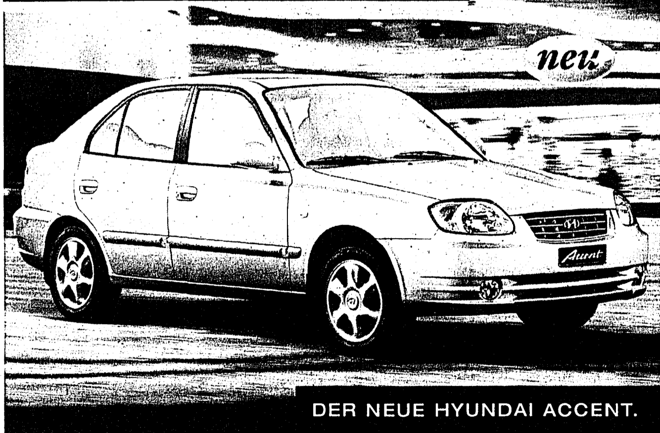
DER NEUE HYUNDAI ACCENT.