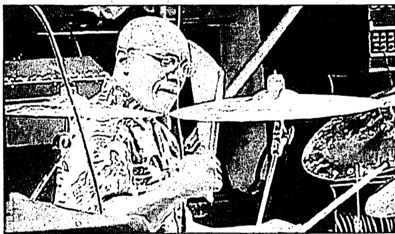
Der Weltstar Billy Cobham ist Gast am diesjährigen Weinfest in Malans.