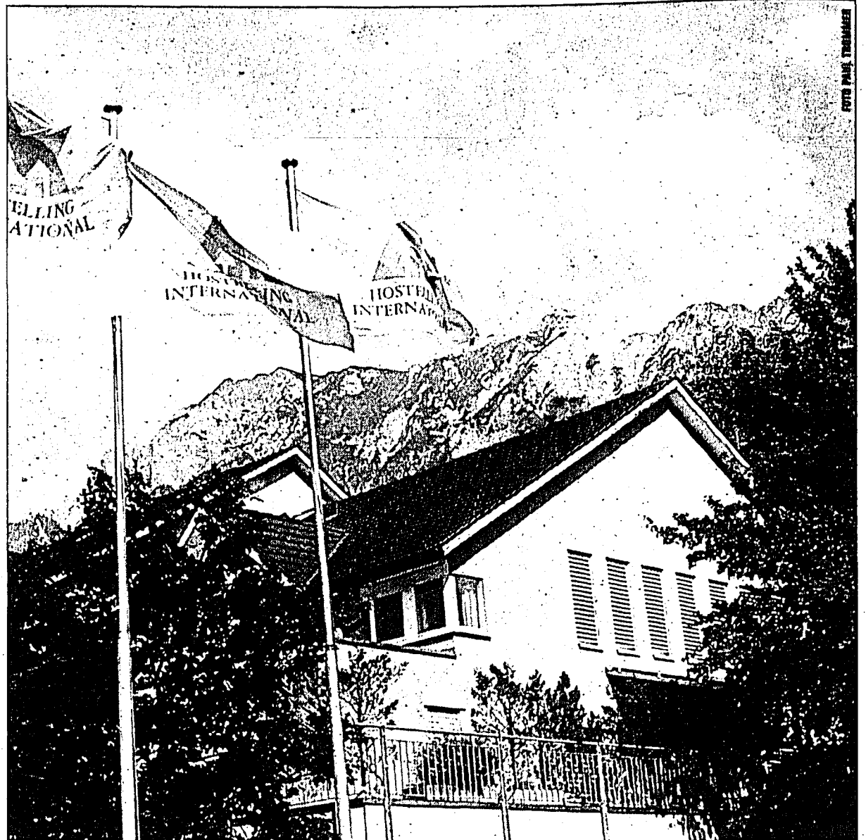
Die moderne Jugendherberge Schaan/Vaduz in der Rüttligasse ist Ausgangspunkt für viele Ausflüge.