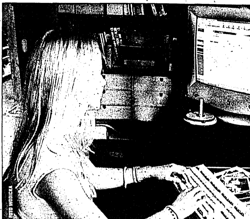
Usern, die illegal Dateien downloaden, soll das Fürchten gelehrt werden.