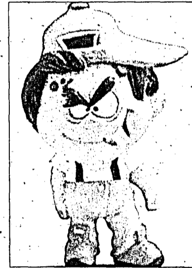
The Master Blaster.