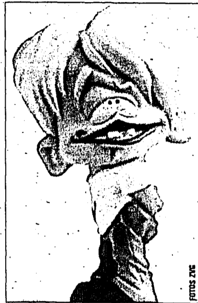
Butt Breath Bob.