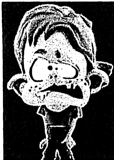
Dog Breath Danny.

«Wir mussten die Puppen bereits nachbestellen», sagt Elisabetta Macri von der Mikado Hobby, Spiel und Freizeit AG in Vaduz. «Ich verstehe zwar nicht ganz warum, aber die sind wirklich der Renner. Die Puppen sind derzeit nicht einmal lieferbar. Die ersten 48 Stück, die wir hatten, wurden jedenfalls sofort verkauft.» (LE)