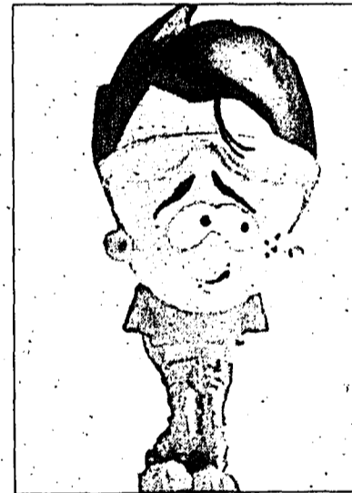
The Silent Gasser.