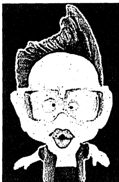
Fish Mouth Fred.