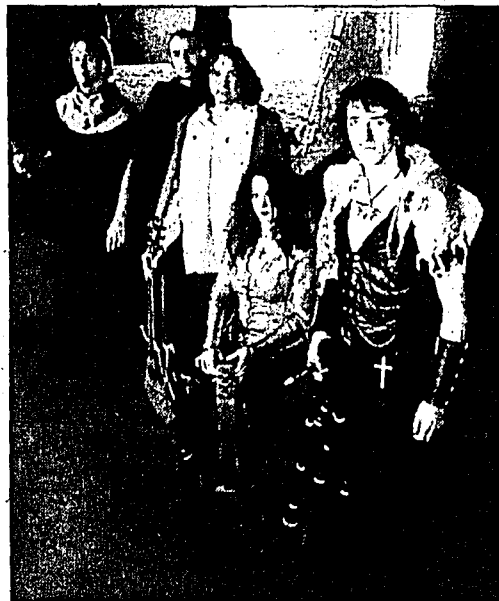
Am 25. Juli auf Burg Gutenberg: Adaro mit mystischem Mittelalter-Rock.

BALZERS – Nach dem Erfolg im letzten Jahr gastiert die deutsche Formation Adaro nochmals auf Burg Gutenberg in Balzers.