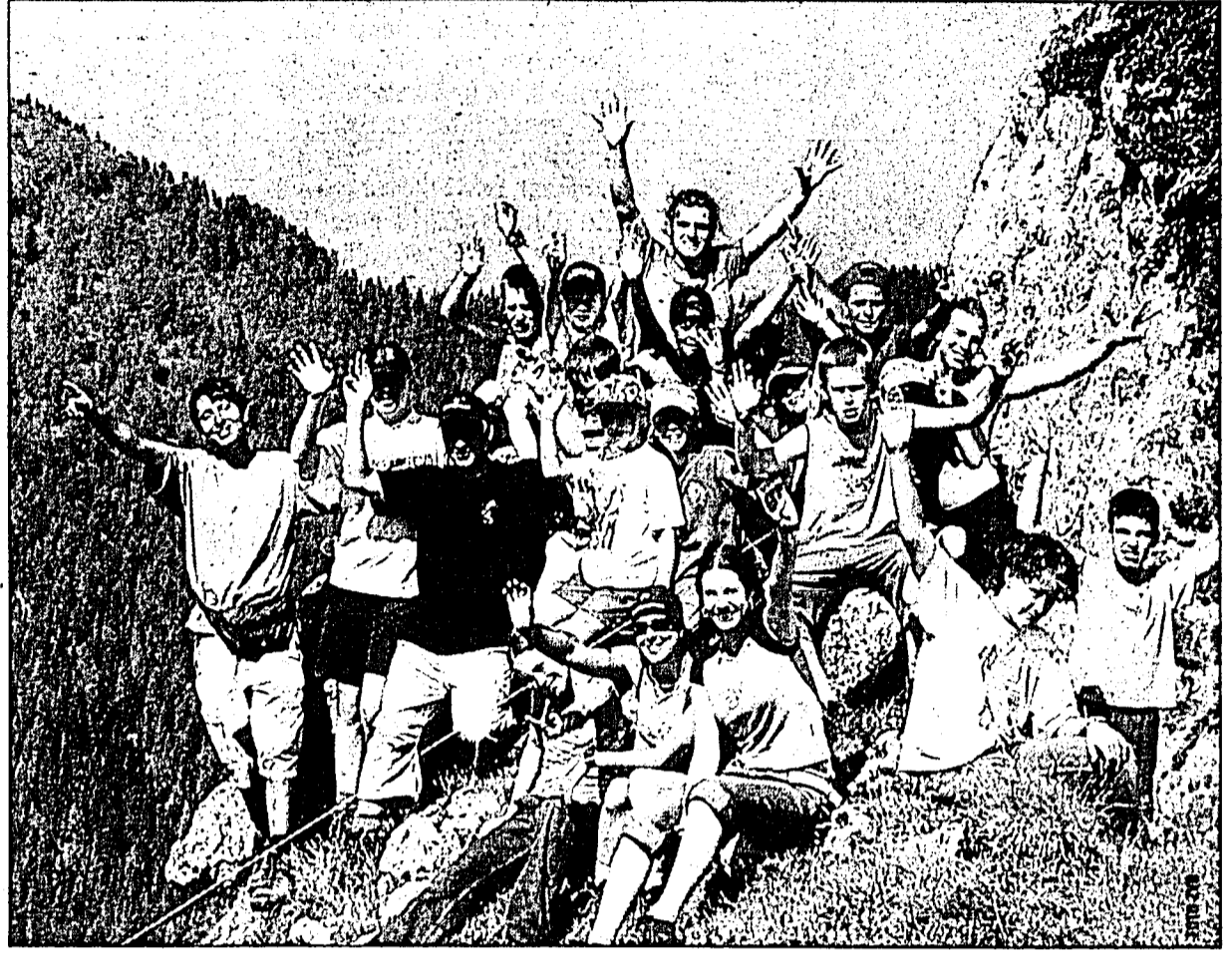
Auch Wandern ist im Programm mit einbezogen, und dabei kommt auch die Freude nicht zu kurz.

Für das zweite Lager (20. bis 26. Juli) können bis Sonntag noch An-