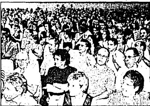
In der Mehrzweckhalle des bzb In Buchs fand am Freitagabend die Diplomfeier der kaufmännischen und der gewerblich-industriellen Berufe statt.