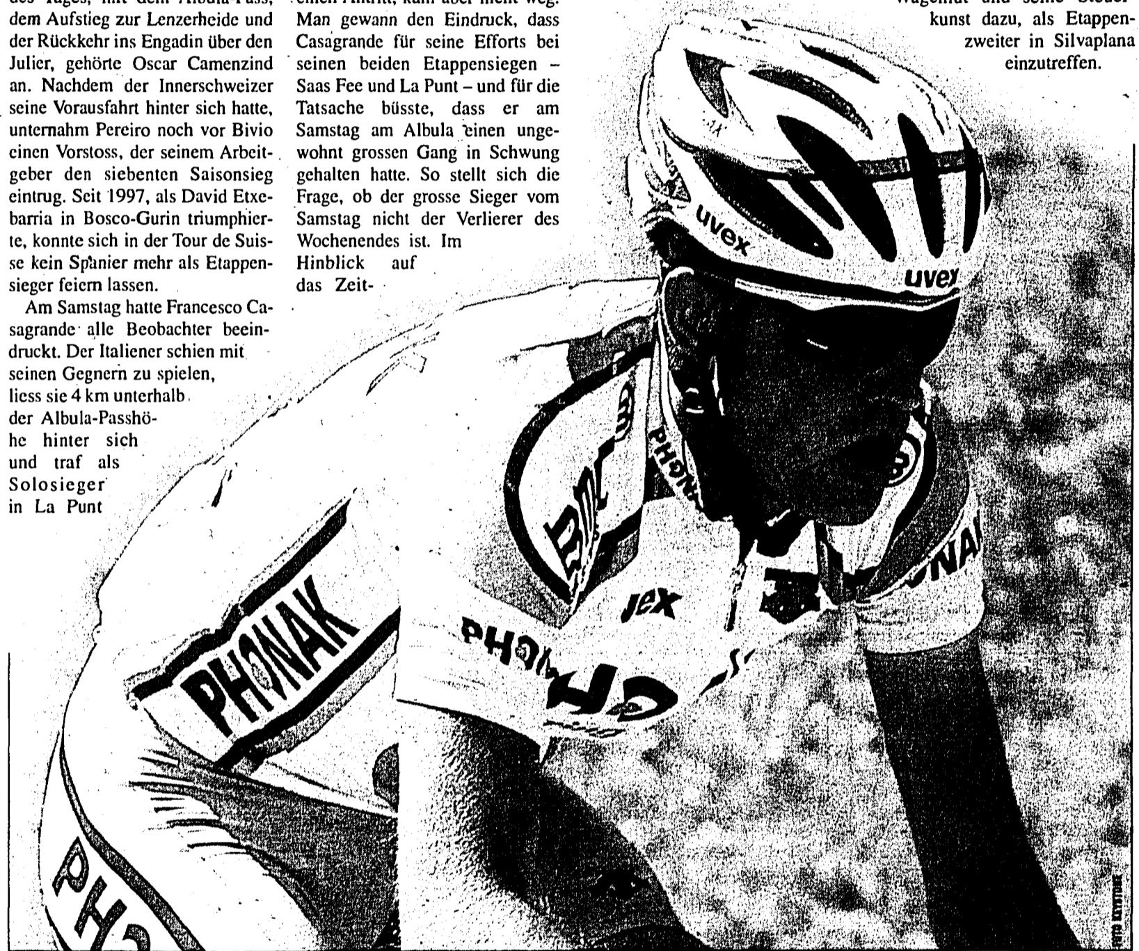
Phonak-Fahrer Oscar Pereiro konnte als erster Spanier seit 1997 eine Tour-de-Suisse-Etappe gewinnen.

Der Vorgang wiederholte sich am Sonntag. Zuerst war Ullrich aus dem Kreis der Besten eliminiert. Dann fand sich der Wahlschweizer plötzlich in der besten Gesellschaft wieder. In der Abfahrt vom Julier nutzte Ullrich seinen Wagemut und seine Steuerkunst dazu, als Etappen-zweiter in Silvaplana einzutreffen.