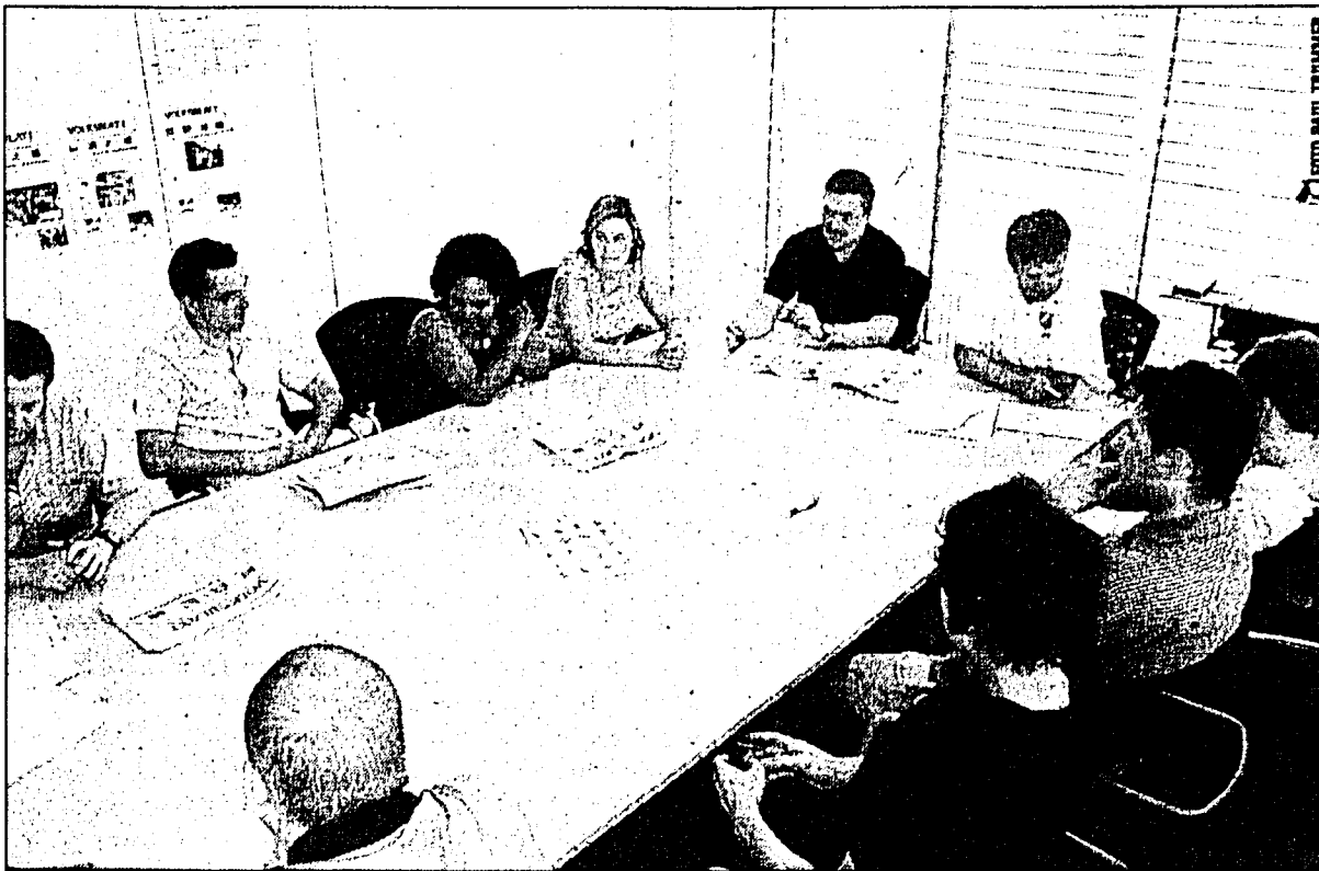
Zweimal täglich trifft sich die Redaktion, um den Inhalt der Volksblatt-Ausgabe des kommenden Tages zu besprechen.

Ein weiterer Vorteil der Caddy's war auch für die zukunftsorientierte Entwicklung gedacht. Falls die Räumlichkeiten zu eng werden, ist die Möglichkeit vorhanden, aus bestimmten Arbeitsplätzen Desk-Sharing-Arbeitsplätze zu gestalten. Die Anordnung der Arbeitsplätze war durch die Anzahl der Beschäftigten und Wahl der Tischformen vorgegeben. In den Einzel- und Doppelbüros erhielten die Arbeitsplätze Unterstellkorpusse, da der Platz beschränkt war. Die Schränke sind offen gehalten, weil mehrere Personen Zugang benötigen.