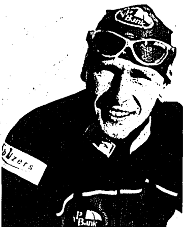
Balzers und LKW - in wenigen Wochen zwei Hauptpartner akquiriert.