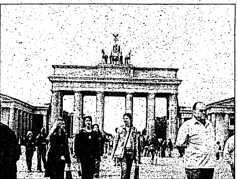
Das Brandenburger Tor – Wahrzeichen von Berlin.