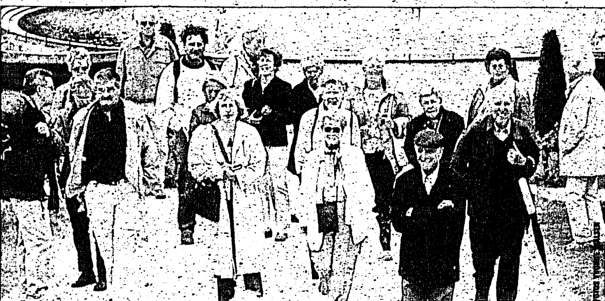
Die teilnehmenden Leser/-Innen der Volksblatt-Jubiläumsreise nach Berlin.

Volksblatt-Jubiläumsreise nach Berlin – Begeisterte Teilnehmer