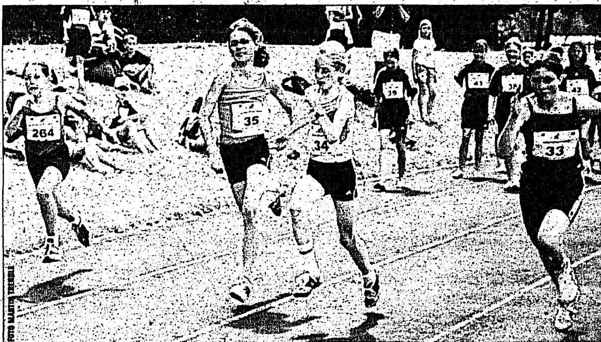
Voller Einsatz und Hochspannung war beim Sprint angesagt.