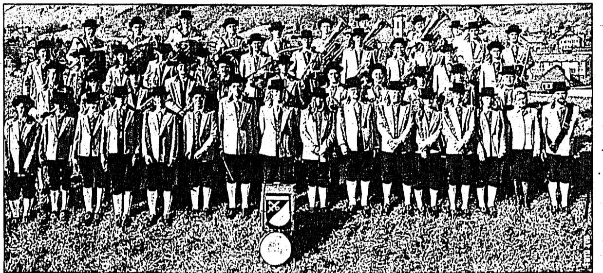
Der Musikverein Mauren zeichnet dieses Jahr für das Verbandsmusikfest verantwortlich.

Am Freitagabend wird das Fest mit der bekannten Band «Blehblos'n» aus Bayern im Festzelt am Weiherring eröffnet. Auf musikalisch hohem Niveau verbreiten die «Blehblos'n» gute Stimmung und eine ausgelassene Atmosphäre, bei welcher getanzt, gefeiert und gesungen werden kann. Das Markenzeichen der Band ist fetzige Musik und Lust am Witz. Lassen Sie sich nicht vom Namen der Band täuschen und lassen Sie sich von uns überzeugen, dass mit den «Blehblos'n» die Post abgeht. Unter anderem spielen die «Blehblos'n» immer wieder am Oktoberfest in München, am Gauderfest im Zillertal sowie an Privatpartys des FC Bayern Münchens.