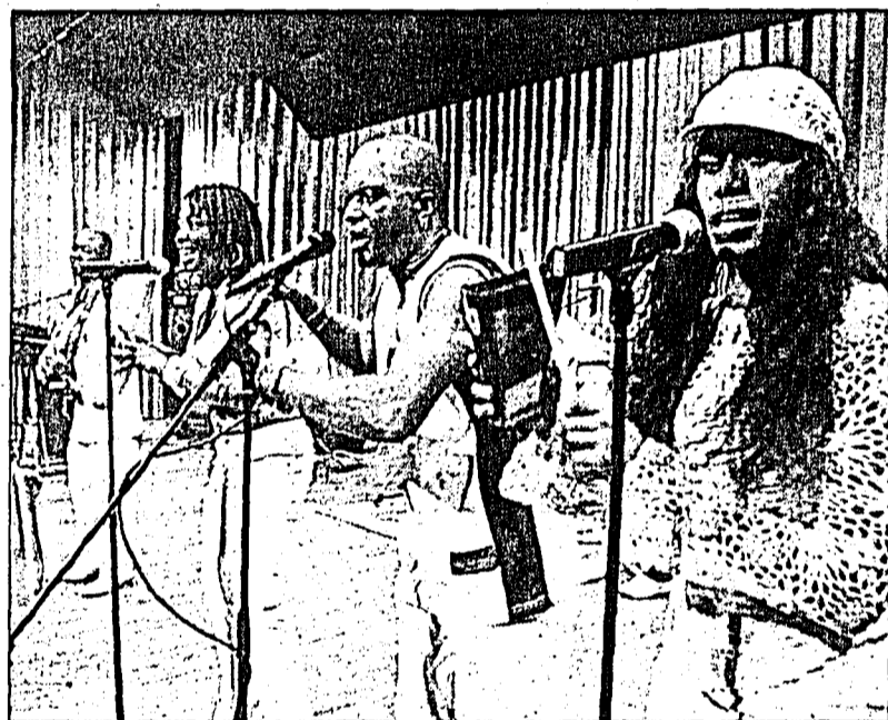
Hochstimmung herrschte am Samstagabend im Triesner Saal.

Noche Latina der Tanzschule «Caribe Tropical»