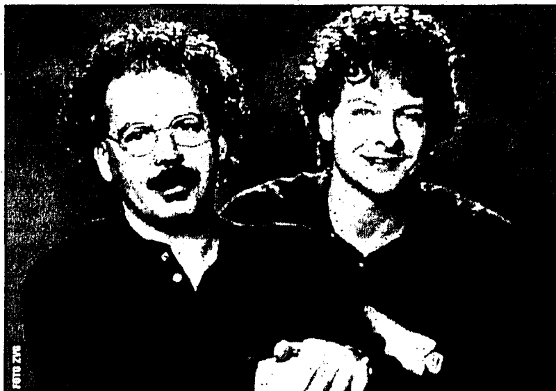
Im TaK werden der Liedermacher Gianmaria Testa und der Gitarrist Pier Mario Giovannone zu hören sein.

Sind es Lieder oder sind es Geschichten, die Gianmaria Testa mit ruhiger Stimme vorträgt? Aus Text, Melodie und Harmonie entfaltet sich eine eigene Welt. Nur auf den ersten Blick scheint sie klein. Gesten und Blicke gewinnen Bedeutung und das Warten auf einem stillen Bahnhof kann der Beginn einer weiten Reisen zu sich selbst sein. Der internationale Erfolg sind Gianmaria Testa nicht zu Kopf gestiegen. Er bleibt, was er war: Der Bahnhofsvorsteher von Cuneo.