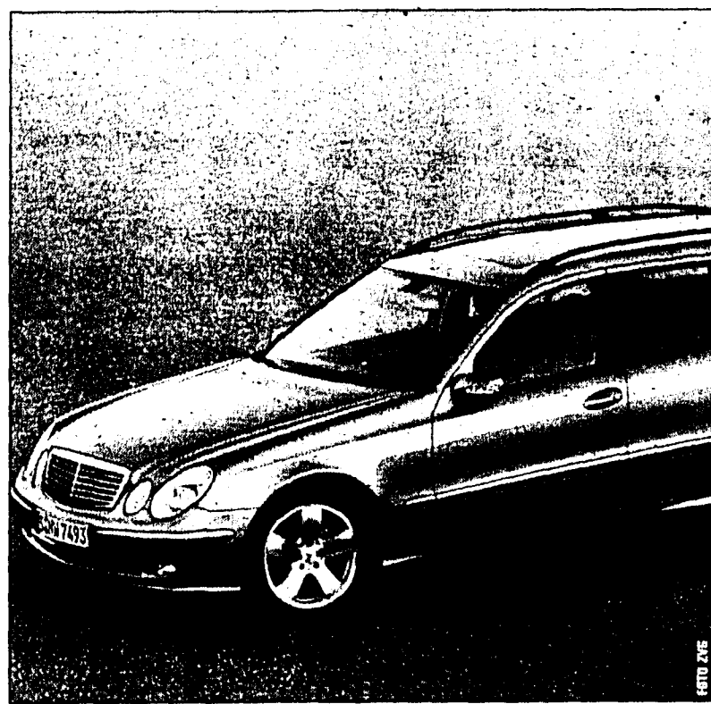
Beim Autosalon in Genf hatte das T-Modell von Mercedes-Benz den ersten Auftritt in Europa. Am Wochenende wird es bei der Garage Weilenmann gezeigt.

Für die neue Mercedes-Kombilimousine stehen zunächst drei Benzin- und drei CDI-Dieselmotoren mit einem Leistungspek-