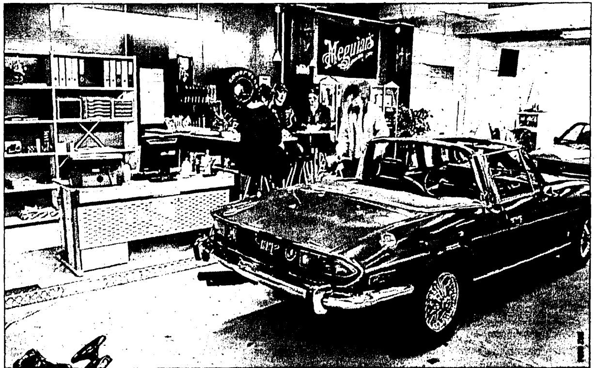
Der freundlich gestaltete Kunden- und Verkaufsraum von SmileCar GmbH lädt zum Verweilen ein.