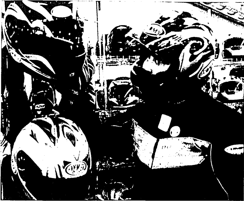
Nicht nur Motorrader wurden an den Ausstellungen gezeigt, sondern auch die sicheren und unerlässlichen Accessoires.

Ingenieure immer noch ein breites Betätigungsfeld. Erwähnenswert in dieser Beziehung sind drei Neuheiten: Der überarbeitete Luxus-Scooter Honda Silver Wing 600, der jetzt über ABS verfügt, die beiden italienisch-elegant gestylten Aprilia Scarabeo 500. Technisch sehr interessant ist der Peugeot Jetlore 125 mit Kompressor aufgeladenem Motor.