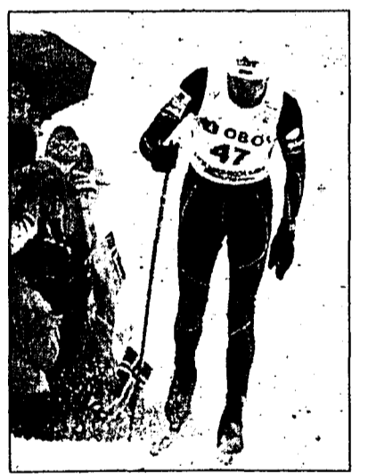
Andrus Veerpalu siegte am Holmenkollen in Oslo über 50 km.

OSLO - Andrus Veerpalu hat in Oslo den Langlauf-Weltcup über 50 km im klassischen Stil gewonnen. Bente Skari feierte bei den Frauen (30 km) den 39. Weltcup-Sieg ihrer Karriere.