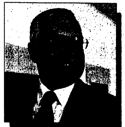
Tschechiens neuer Staatspräsident Vaclav Klaus.

Durchgang mit 142 Stimmen gewählt, als die einfache Mehrheit der insgesamt 281 Parlamentarier ausreichte.