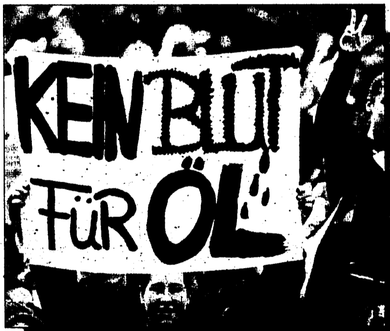
Die Demonstrationen gegen den Krieg (hier in Deutschland) dauern an.

BAGDAD - Irak beugt sich dem Ultimatum von UN-Chefinspekteur Hans Blix und hat die Zerstörung erster El-Samud-2-Raketen für Samstag angekündigt.