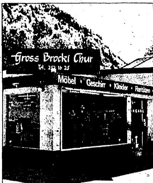
Gross-Brockli in Chur sammelt wiederverwertbare Artikel.