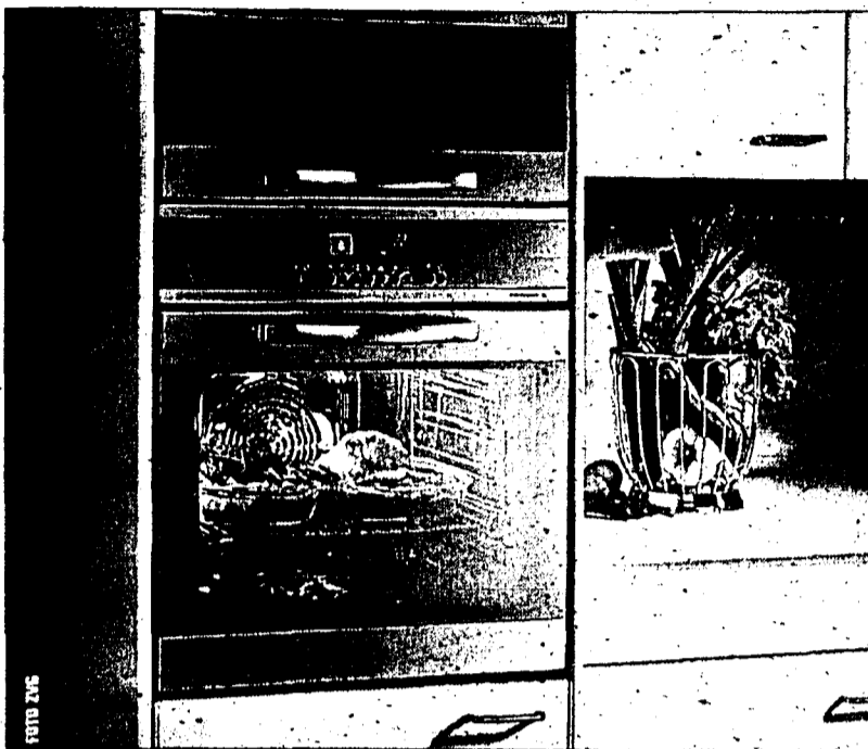
Der Profi Steam wird heute Freitag von 10 bis 12 Uhr und von 13.30 bis 18 Uhr sowie morgen Samstag zwischen 10 und 15 Uhr bei den LKW vorgestellt.

Auf den ersten Blick unterscheidet sich der Profi Steam kaum von einem herkömmlichen Backofen. Das Gerät ist im Schweizer Massensystem oder in Euronormgrösse erhältlich, der Innenraum bietet genau so viel Platz wie andere