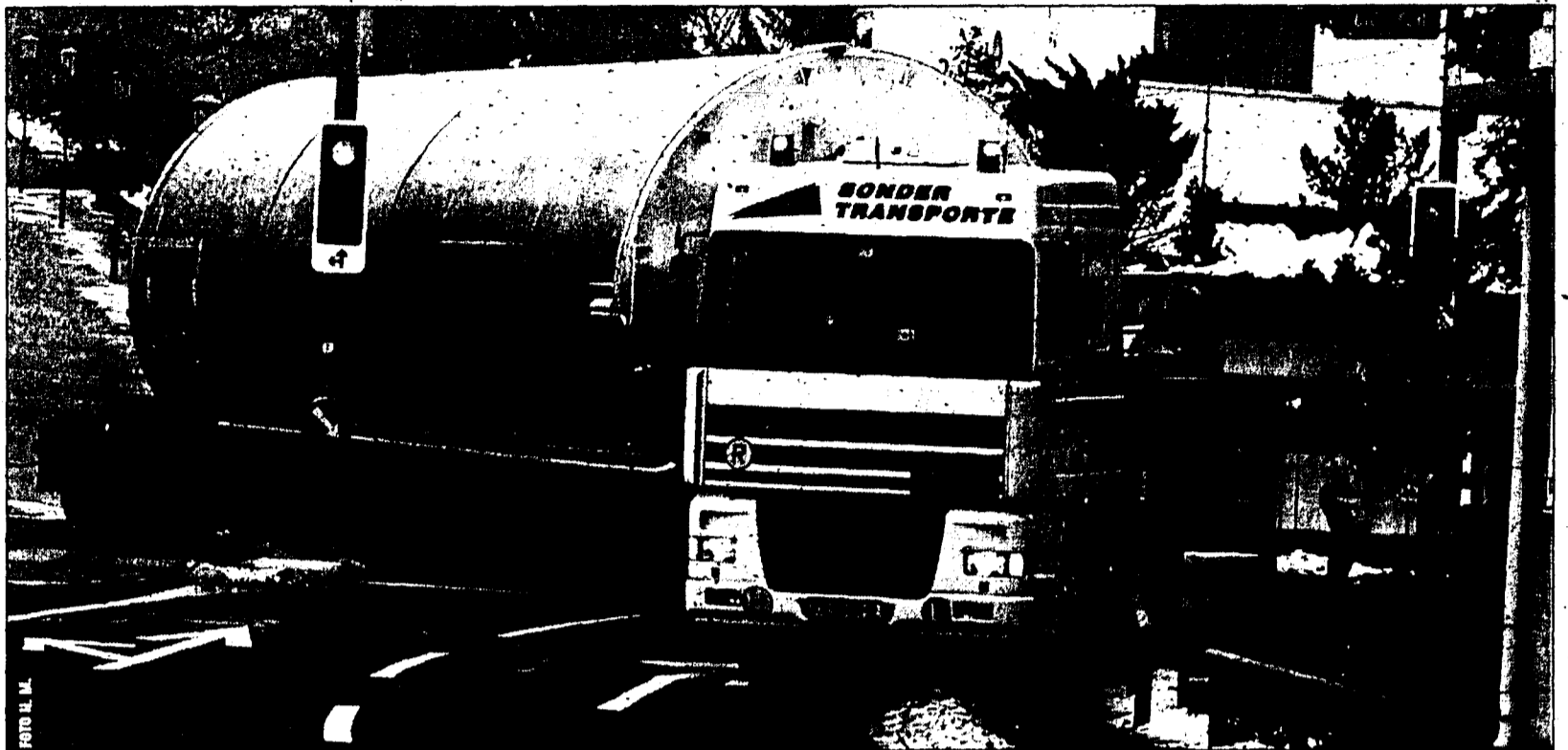
Die Verkehrsinsel (links im Bild) stellte für den Sondertransport anfänglich ein nicht überwindbares Hindernis dar.

Einem Sondertransport wurde gestern eine Verkehrsinsel zum Verhängnis