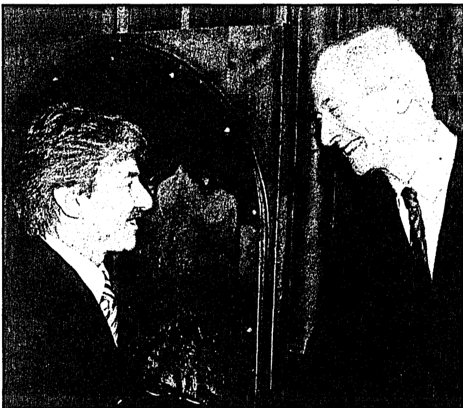
Einer der zahlreichen Gratulanten aus den Reihen des Landtages: der Landtagsabgeordnete Peter Lampert.