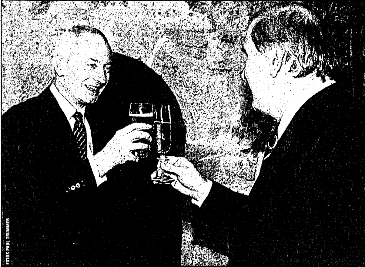
Alles Gute zum Geburtstag, Durchlaucht: Regierungschef Otmar Hasler überbrachte dem Landesfürsten die Glückwünsche seitens der Bevölkerung und der Regierung.

Empfang zu Ehren des 58. Geburtstages von S. D. Fürst Hans-Adam II. gestern auf Schloss Vaduz