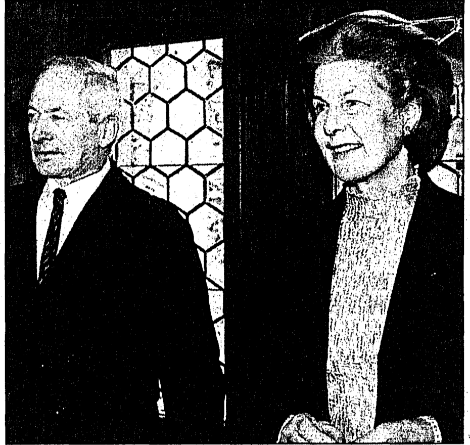
Geburtstagskind mit Gattin: S. D. Landesfürst Hans-Adam II. und I. D. Landesfürstin Marie anlässlich des Empfangs der Gäste.