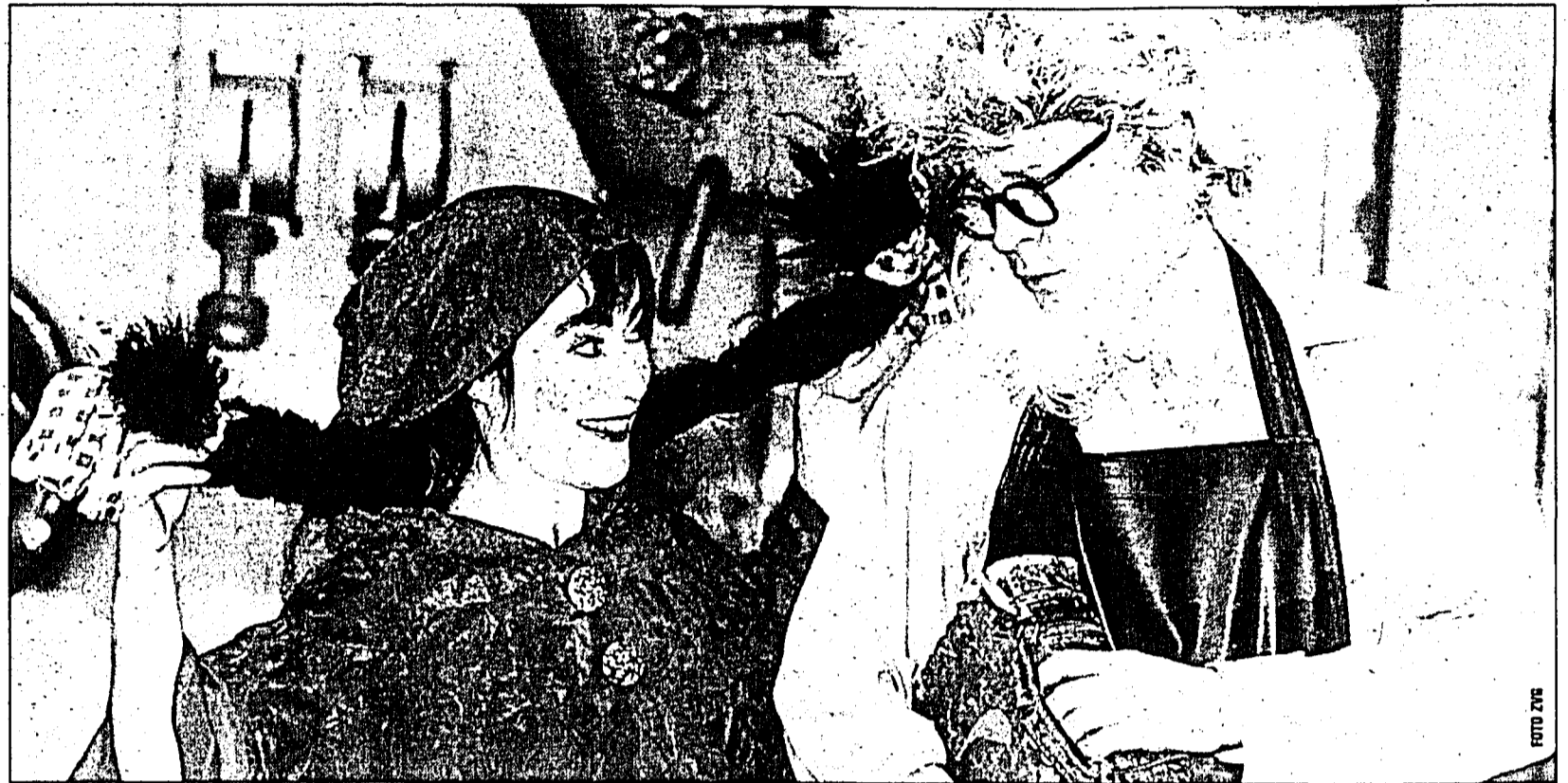
Was tut das Rotkäppchen beim Herrn Professor? Das Theater Gómez-Müller hat die Antwort mit seinem Stück «Die Märchenmaschine» parat.

Das Theater Gómez-Müller zeigt im «Alten Kino» Mels «Die Märchenmaschine»