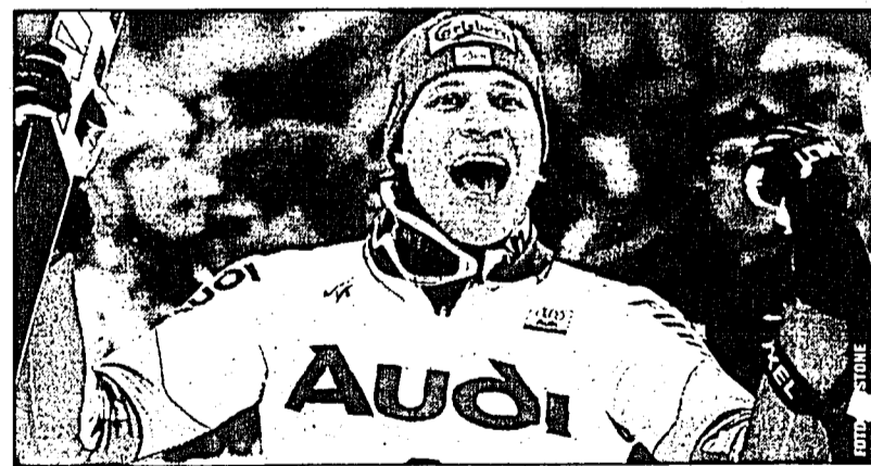
Die Freude war gross: Sieger Kalle Palander.