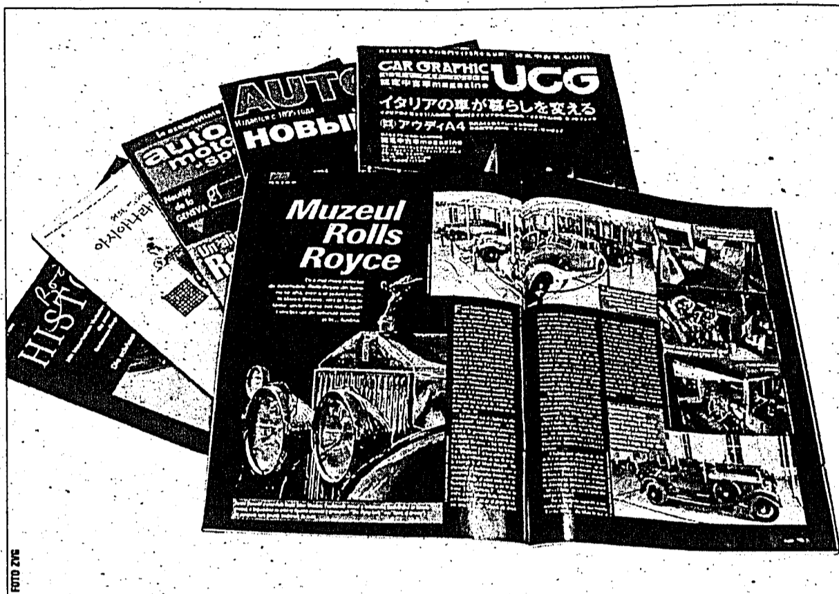
Das Rolls-Royce-Museum in Dornbirn stösst auf internationales Interesse.

«Das grösste RR-Museum der Welt», titelte kürzlich etwa ein koreanisches Hochglanzmagazin. Eine japanische Autozeitung lobte die «Sammlung und Restauration von Rolls Royce Phantom» in ihrer Schlagzeile, die Fachzeitschrift «Auto motor si sport» in Bukarest und die Zeitschrift «Autocar» in Moskau gaben in ihren Ausgaben ihrer Faszination über das einzigar-