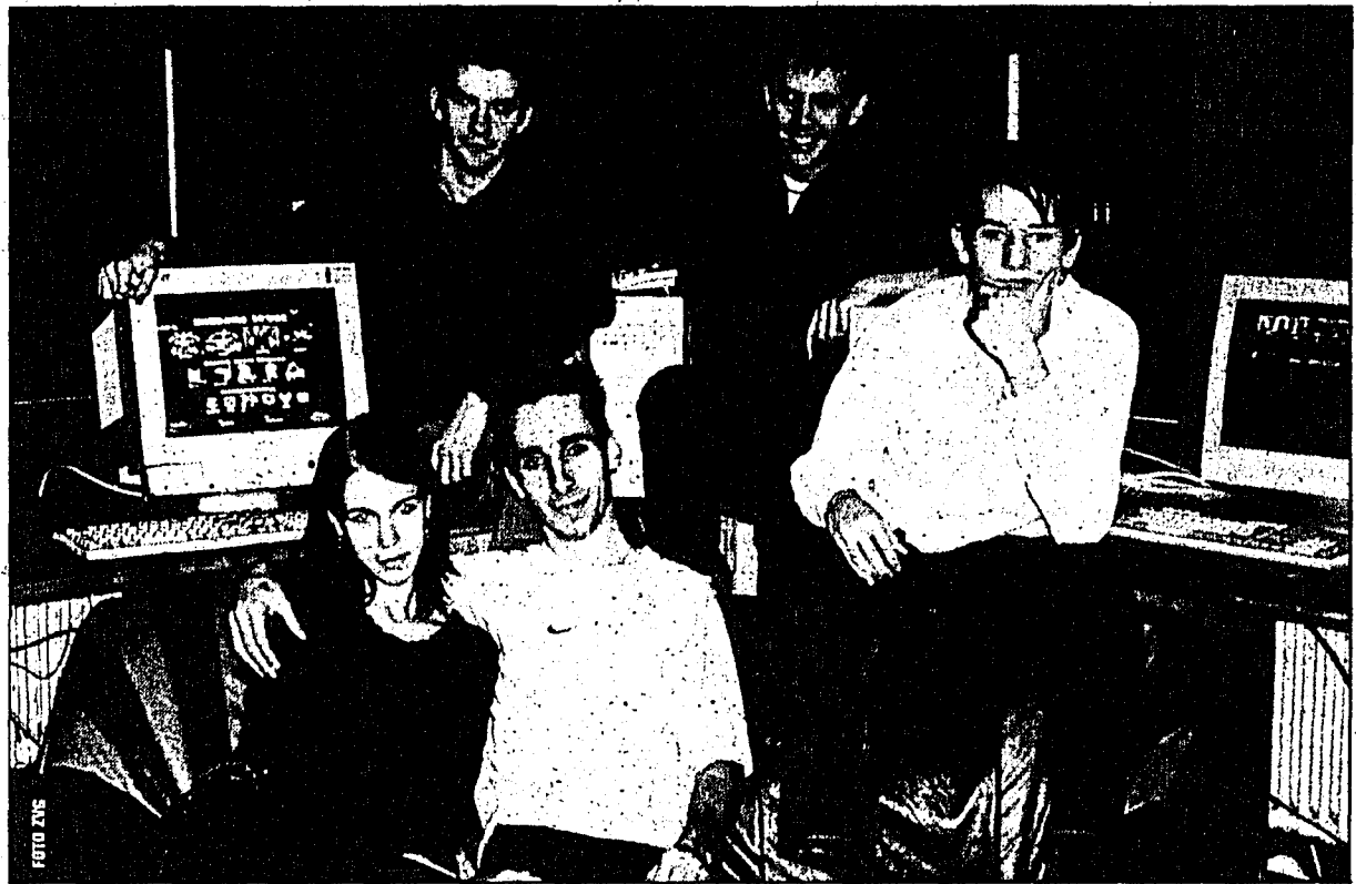
Der Quake Club Mauren lädt zu einem Anlass ein, wie es ihn in Liechtenstein erst einmal gab. Im Bild die Verantwortlichen der Lan-Party.

wie der Gemeinde Mauren, Harlekin, Typolay, LLB, Tifitech und dem Liechtensteiner Volksblatt können wir wieder solch einen Anlass durchführen», unterstreichen die Verantwortlichen. Das Turnier wird mit einer dreitägigen Party mit verschiedenen DJs (z. B. DJ Quake) kombiniert. Die Türöffnung ist am Freitag, 10. Januar um 18.30. Das