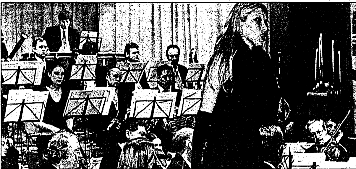
Das Symphonische Orchester Liechtenstein überbrachte seine Neujahrgrüsse für das Jahr 2003 vergangenen Sonntag in Mauren.