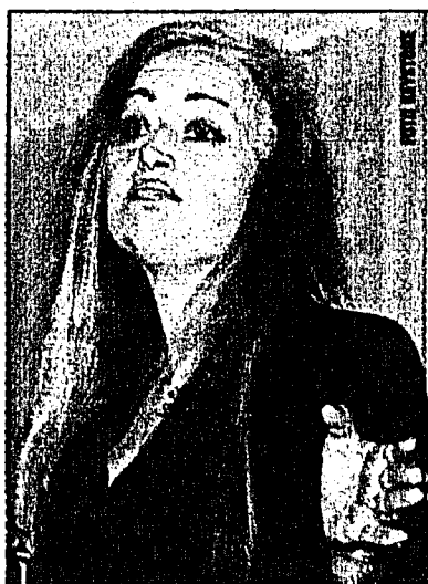
Brigitte Boisselier gab die Geburt des Klonbabys bekannt.