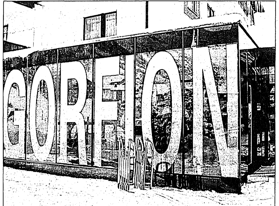
Ausblicke – Einblicke ... fließende Formen im Verbindungsbau.