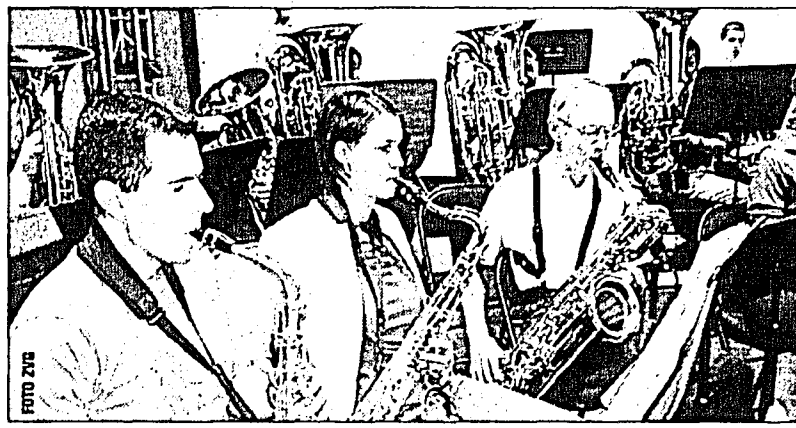
Am Stephanstag findet das Passivkonzert der Harmoniemusik Schaan statt.

Unter anderem hören Sie Stücke wie Pennywhistle Jig und The Peter Gunn Theme von Henry Mancini, Harlem Nocturne von