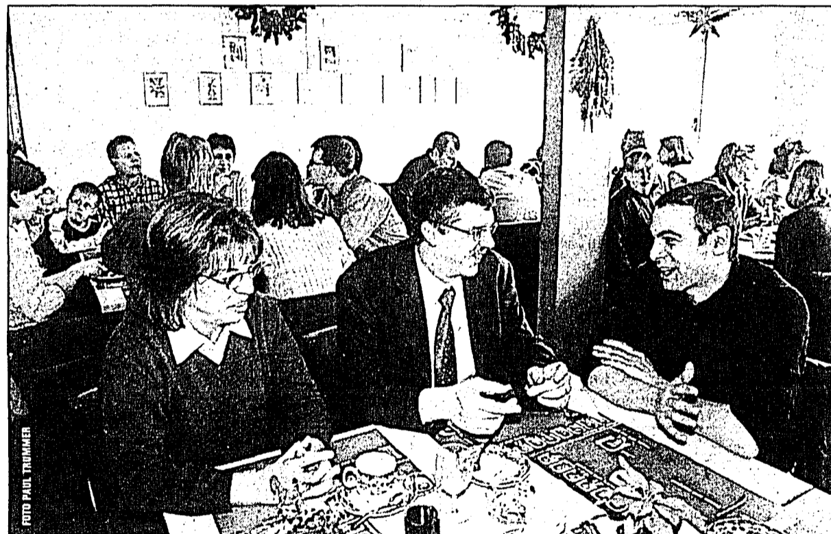
Einen grossen Andrang gab es gestern beim Familienzorga im Café Hoop in Eschen. Nebst einem zünftigen Frühstück bot sich auch die Gelegenheit, mit den FBP-Gemeinderats- und Vorsteherkandidaten von Eschen-Nendeln zu plaudern. Ein Clown sorgte dafür, dass auch die zahlreichen Kinder Unterhaltung fanden.