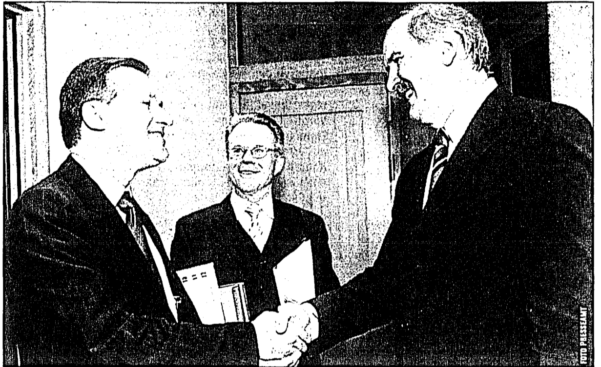
Sehr gute und freundschaftliche Zusammenarbeit: Österreichs Innenminister Ernst Strasser, Regierungsrat Alois Ospelt und Regierungschef Otmar Hasler.

in der Grenzüberwachung vorangekommen. Dadurch solle die notwendige Sicherheit, die Schengen verlangt, gewährleistet werden. Diesbezüglich wurde die Einset-