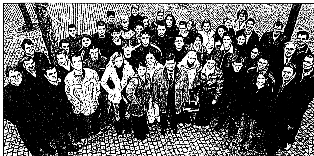
Die Jungbürgerinnen und Jungbürger von Balzers trafen sich am Samstag zur traditionellen Feier, zu welcher die Gemeinde eingeladen hatte. Bei guter Stimmung wurde rege diskutiert und natürlich gefeiert.