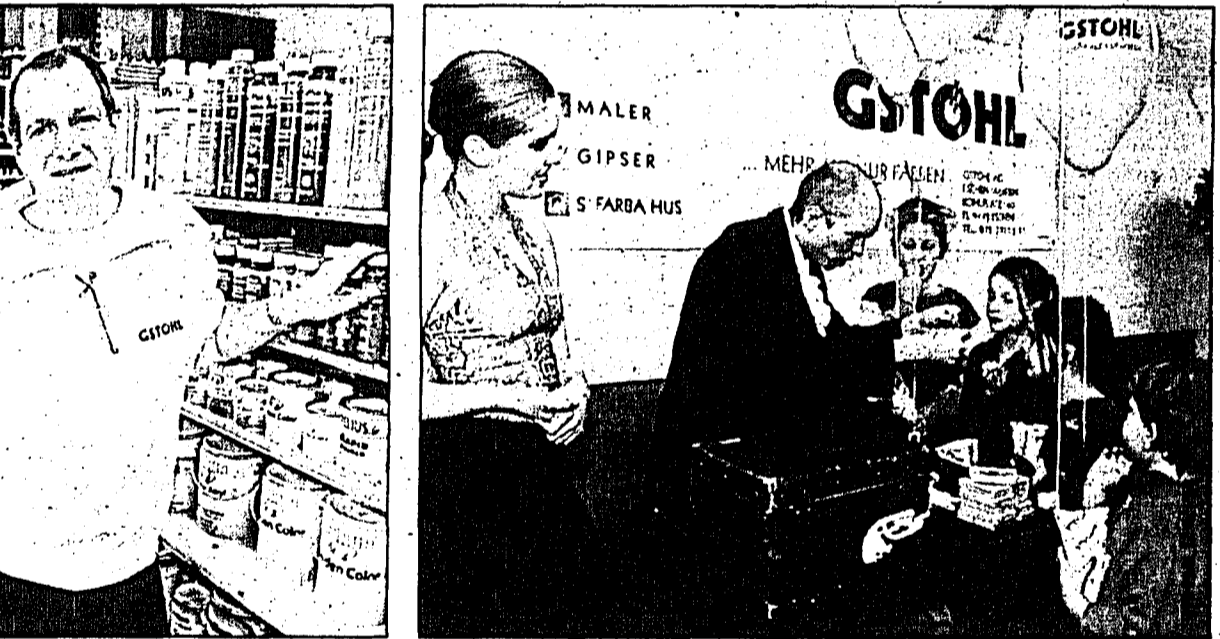
Auf die Gäste warteten zahlreiche Attraktionen.

ISO 9002 zertifiziert. Ein Jahr später schlossen sich die beiden eigenständigen Firmen zur Gstöhl AG, Maler- und Gipsergeschäft Eschen-Mauren, zusammen und beschäftigen heute über 50 zuverlässige und kompetente Mitarbeiterinnen und Mitarbeiter. Pünktlich zum Geburtstagsfest ist die vierte Kundenzeitschrift «farbige Seiten» erschienen,