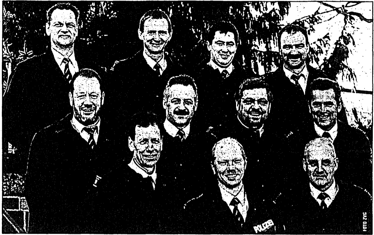
Die Gemeindepolizisten trafen sich heuer in Mauren zum regelmässigen Erfahrungsaustausch.

Die Gemeindepolizisten sind zuständig für Sicherheit, Ruhe und