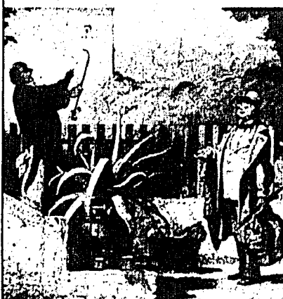
Besuch auf dem Lande, um 1860. Ausschnitt. Privatbesitz.

Die poetisch-romantische Malerei des 19. Jahrhunderts - humorvoll, weltoffen, zeitkritisch - Eine einzigartige Präsentation, die erfreut und begeistert.