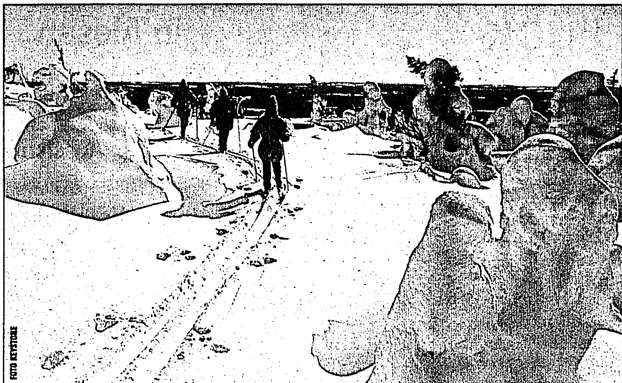
Langläufer vor einer atemberaubenden Kulisse in Finnland.

Wo der Winter seinem Namen alle Ehre macht