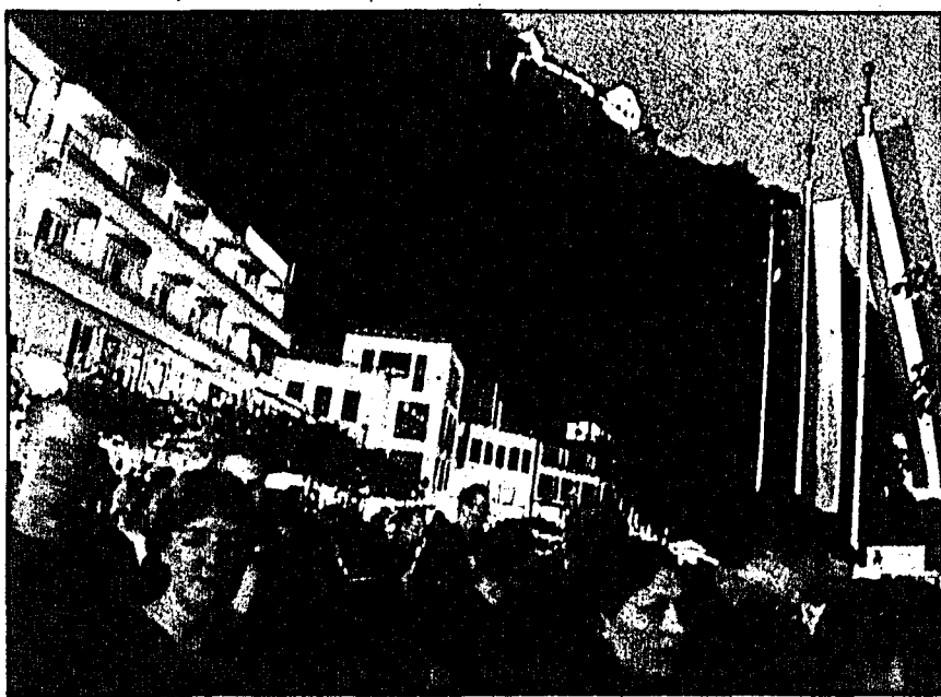
Treffpunkt Vaduz – Events und Lebensfreude durchs ganz Jahr.