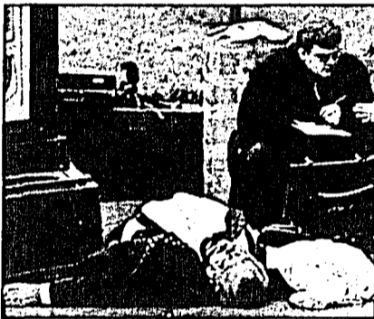
Walentin Zwetkow ist in der russischen Politik das bislang ranghöchste Opfer eines Auftragsmordes.

MOSKAU: Ein hochrangiger russischer Politiker ist in Moskau einem Attentat zum Opfer gefallen. Der Gouverneur der fernöstlichen Region Magadan, Walentin Zwetkow, wurde von zwei Unbekannten erschossen, hiess es gestern aus Polizeikreisen.