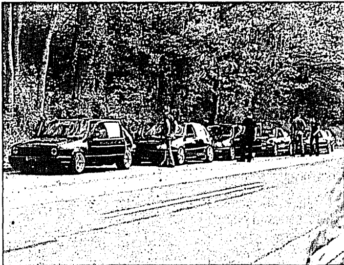
Die Autos sind das Wichtigste für die VW-Fans.