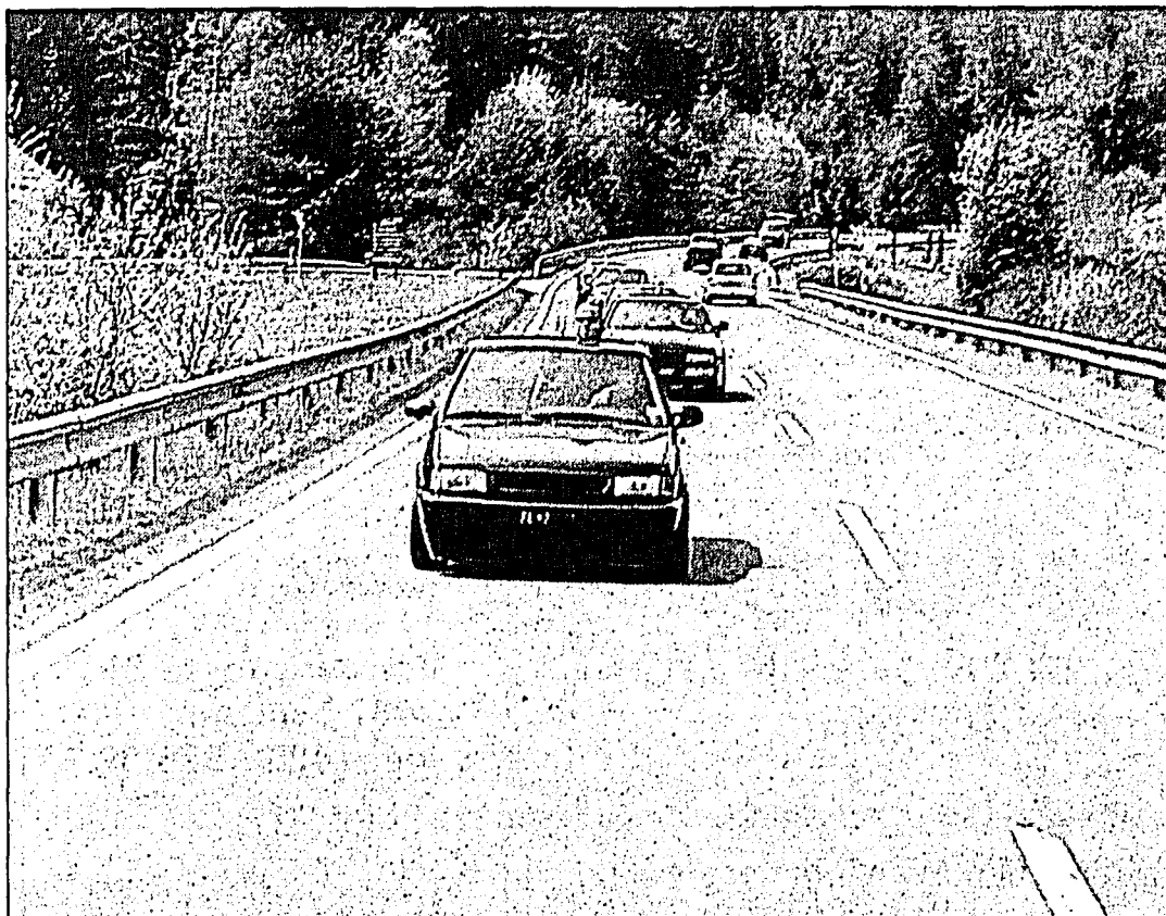
Die 30 Mitglieder gehen gerne auf Autoausflüge. Vor allem Treffen sind begehrt.