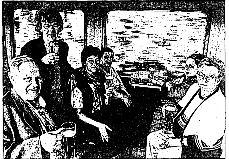
Hier trafen sich drei Triesenbergrinnen mit Vaduzern zu einem gemütlichen Zusammensein in der «Sauschwänzlebahn».