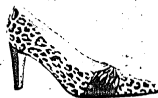
Bei La Piccola in Schaan gibt es Pumps, soweit das Auge reicht. Pumps gelten als Standbohn jeder Garderobe.

Die Vielfalt bei den Kinderschuh ist für die kalte Jahreszeit kaum zu überbloten. La Piccola zeigt, welches die Favoriten sind.