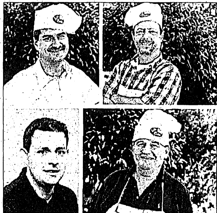
Spitzengastronomen kochen Hausmannskost: Herzlich willkommen in der Vaduzer Kultur- und Flaniermeile - und an Guata!

Um 15 Uhr findet zudem ein Platzkonzert mit einer polnischen Volksmusikgruppe statt, die für ein kurzes Gastspiel nach Vaduz kommt.