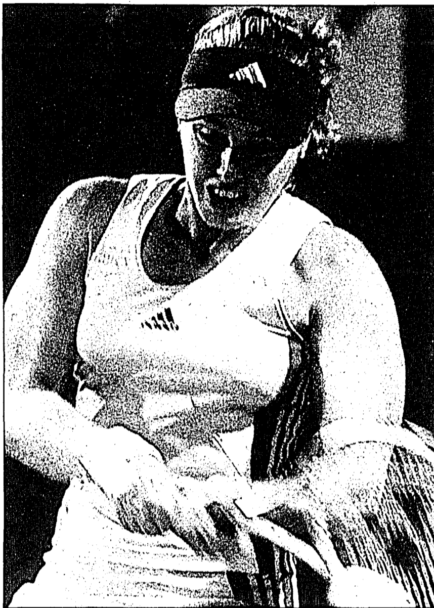
Martina Hingis tritt an den US Open erstmals nicht als Favoritin an.

Bei den Männern war es in letzter Zeit beinahe einfacher, einen grossen